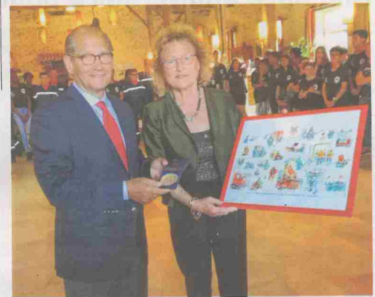
La soirée s'est terminée par un échange de cadeaux.

Une soirée de gala a conclu la semaine de Raid pour les pompiers juniors formés par le SDIS 91.