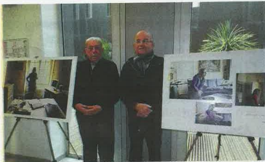
Les représentants des associations souhaitent mettre à l'honneur le travail des aidants.

Des associations veulent alerter sur la souffrance des familles de personnes malades.