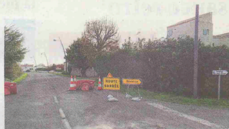
Déviation via les hameaux la Bernardière et Font Renaud

Cependant la commune de Port-des-Barques dans le cadre du PAPI avait besoin de faire convoier des rochers destinés à la construction de la digue. Ces convois ont notamment été réalisés par des poids