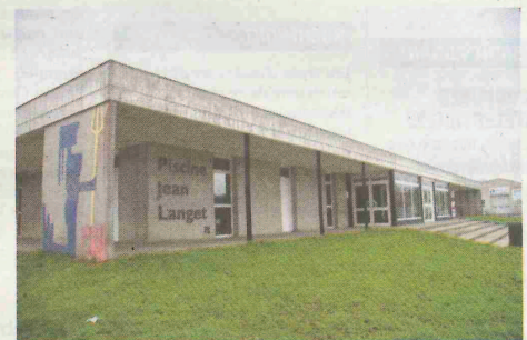
La piscine Jean Langet, à Rochefort, a été construite dans les années 1970

La communauté d'agglomération Rochefort Océan (Caro) a mis en ligne un questionnaire sur son offre de piscine. Elle en possède aujourd'hui deux : la piscine couverte Jean Langet à Rochefort, vieillissante, et la piscine d'été de Tonnay-Charente.