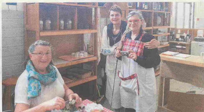
Les bénévoles sont heureux d'accueillir Rochefortais et touristes pour un échange convivial