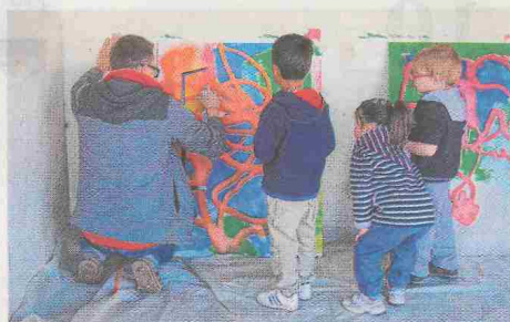
La précédente exposition de fin d'année