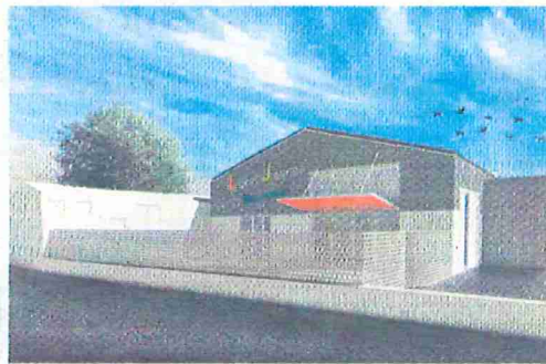
La maquette de l'avant-projet.

La communauté de communes espère 40 % à 50 % de subventions.