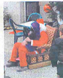
Le père Noël sera évidemment cette année encore la vedette de la journée.

Le 17 décembre de 9 à 17 heures, sur la place des Halles, dans la rue Dubois-Meynardie et la rue Joffe. Animations gratuites, petite restauration sur place.