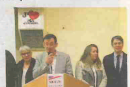
Le périmètre de protection des abords des monuments historiques devrait être restreint.

Didier Portron a également évoqué les projets de parking et de mise en conformité de la salle polyvalente, des travaux pour l'école, les travaux de réhabilitation de l'église dont les nouveaux chiffrages s'élèvent à environ 280 000 euros.