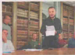
La bonne santé était au cœur d'un débat passionné.

Médecins, thérapeutes, enseignants, philosophes et artistes ont échangé avec les passionnés du sujet, ce mercredi 31 janvier. Ils ont unanimement indiqué que le rayonnement de l'être contribue à