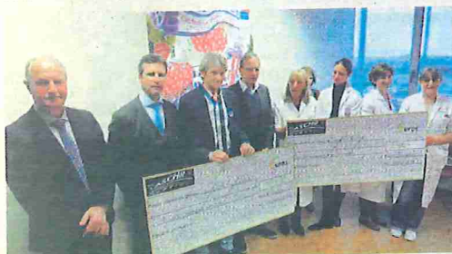
17 500 euros remis par l'association sportive de l'hôpital.