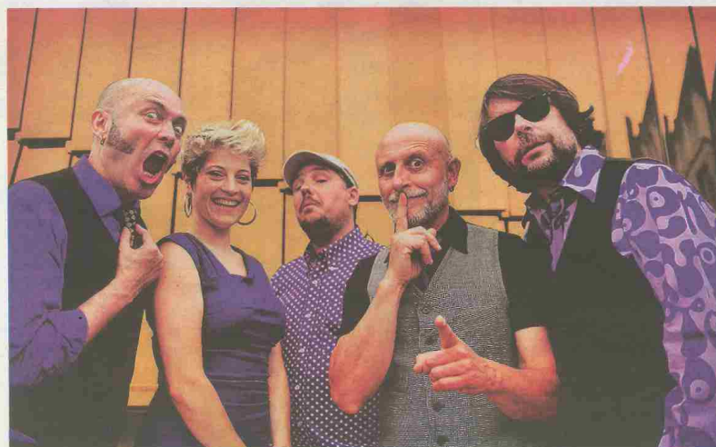
De nombreuses animations sont au programme tout l'été.

Programme de ce lundi 8 juillet sur www.rochefort-ocean.com/organiser/agenda/agenda-complet/les-lundis-de-l-arsenal-1830278